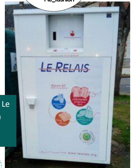
40 Bornes sur l'ensemble du SICTOM réparties sur 31 points de collecte

En cas de débordement des bornes « Le Relais », vous pouvez le signaler en contactant le 02 37 43 63 40.