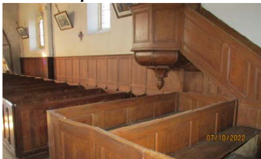
PHOTO : Travaux 2022 : Remplacement de 16 panneaux à partir du poteau jusqu'à sous l'escalier qui monte à la chaire