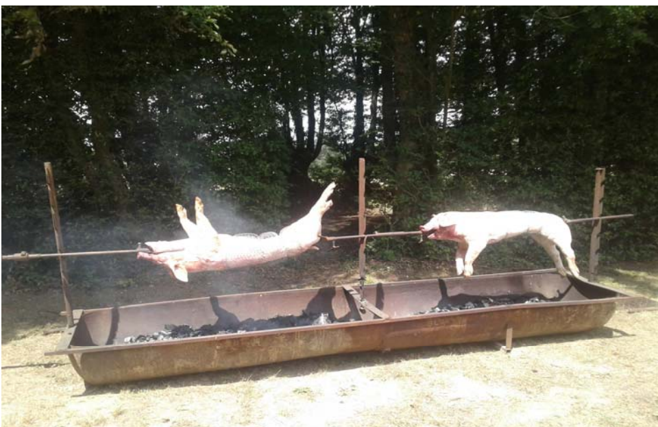
Journée cochon grillé 2022

Président du Comité des Fêtes de Béthonvilliers