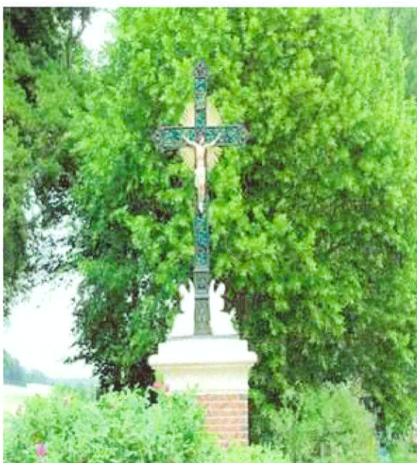
Calvaire du terrain de sport

Ce travail a été réalisé de façon bénévole par les élus de la commune.