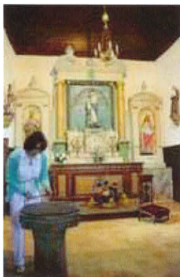
La chapelle de la Vierge fleurie pour le 16 août (photo 5147)