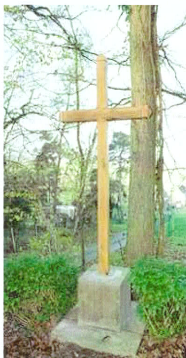
Calvaire du Chailloy