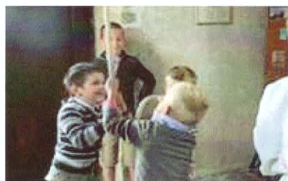
Des sonneurs de cloches en culotte courte (photo 5149) Une église animée (photo 5155)