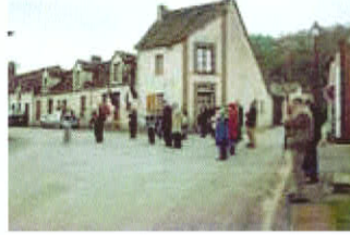
11 novembre 2015

Le Noël des enfants, spectacle ouvert à tous, remise des cadeaux aux enfants et goûter.