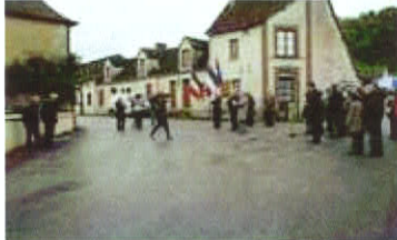
08 mai 2015

Commémorations du 8 mai et du 11 novembre avec le pot de l'amitié ouvert à tous.