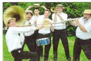
Ensemble Dixie Street pour le concert du 29 septembre