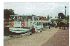
Embarquement sur le canal

Cette année, la sortie du club a eu lieu le jeudi 03 octobre . Le voyage organisé par les cars DELAFOY d'ILLIERS, nous a conduit sur la Loire, à BRIARE. Un circuit en petit train touristique nous a fait découvrir la ville, puis un déjeuner croisière sur le canal, par une journée ensoleillée a été un vrai moment de détente. La visite du Musée de la Mosaïque et des Emaux à clôturé cette journée.