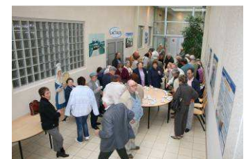
Sortie à Laval

Après un déjeuner dans un restaurant Lavallois, la journée se poursuivait par la découverte de la ville en petit train touristique, puis retour dans le Perche après une petite halte près de la cathédrale des Jacobins au Mans.